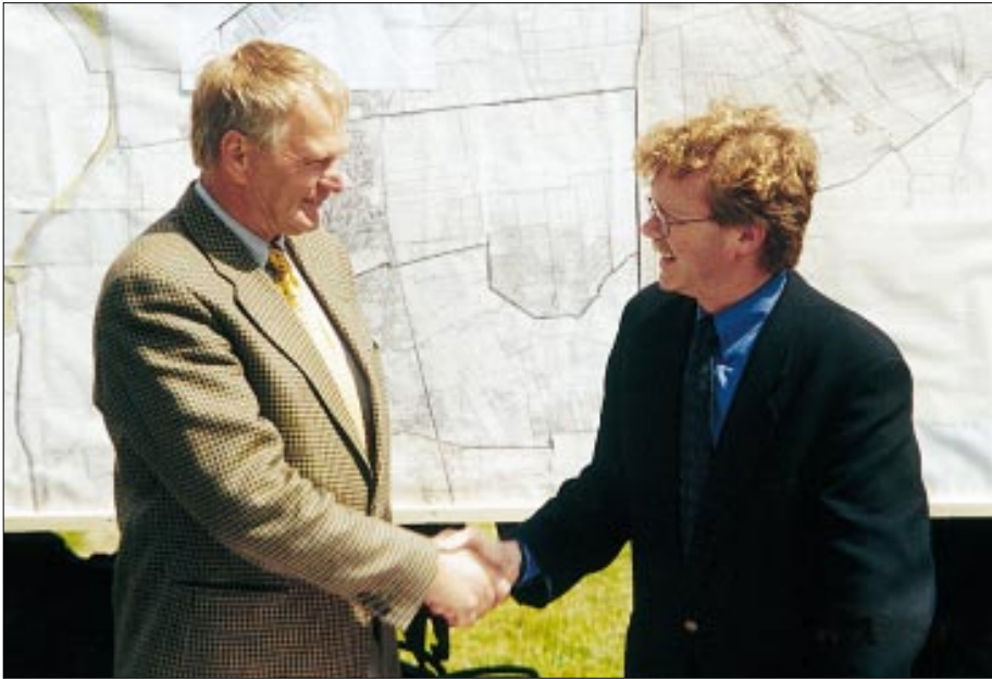
Hauptverbandsvorsteher Boie und Umweltminister Steenblock beim Vertragsabschluß

delte, der von sich aus seine Bereitschaft bekundete, eine Vereinbarung mit Verbesserungen zugunsten der Natur abzuschließen, war eine wichtige Voraussetzung für die erfolgreichen Verhandlungen. In ähnlich günstig gelagerten Fällen, in denen ein Eigentümer über die fraglichen Flächen verfügt oder aber die Eigentümer mit einer Stimme sprechen und in denen nur einzelne für den Naturschutz wichtige Be-