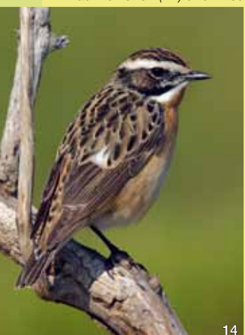
Braunkehlchen (14) und Wiesenpieper (15) sind regelmäßige Brutvögel.