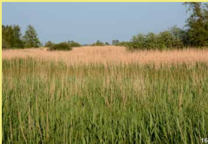
Röhricht und Weidengebüsch

Rohrweihen brüten im Schilf. Sie ernähren sich vorzugsweise von Kleinsäugern und Jungvögeln. Im tiefen Suchflug, dem typischen Gaukelflug, jagen sie über den Schilfflächen. Dabei sind sie gut zu beobachten. Die Rohrweihe ist wie die anderen Weihen durch Verlust und Zerstörung ihres Lebensraumes bedroht. Ebenso reagiert sie empfindlich auf Störungen durch den Menschen in ihrem Brutgebiet. Früher wurde sie stark bejagt. Seit sie ganzjährig unter Schutz steht, haben sich die Bestände wieder erholt.