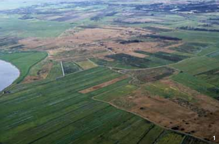
Luftbild des Süderstapeler Westerkooges aus dem Jahr 2002