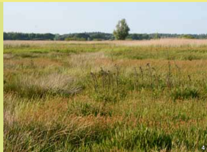
Feuchtwiese im Schutzgebiet

Große Teile des Süderstapeler Westerkooges werden vom Westermoor, einem ehemaligen Hochmoor, eingenommen. Noch bis in die 1960er Jahre wurde