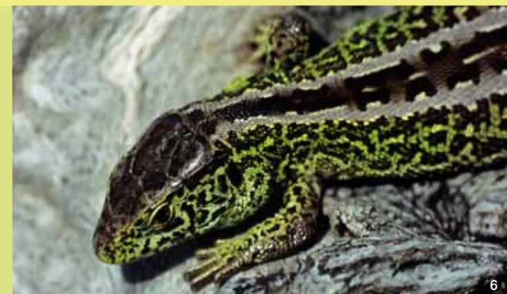
Anfang Mai, mit Beginn der Paarungszeit, sind die Männchen (6) der Zauneidechse auffallend grün gefärbt. Zur Eiablage gräbt das Weibchen (7) an sonnigen Stellen kleine Gruben in den offenen Sandboden. Bei ausreichender Temperatur (21 - 24°C) werden die Jungen von der Sonne erbrütet und schlüpfen nach ca. zwei Monaten.