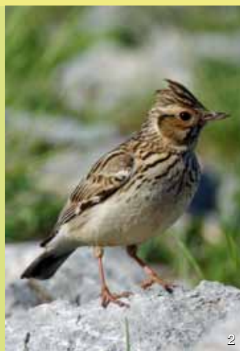
Heidelerche Die Heidelerche (2) liebt sonnige, trockene Offenflächen innerhalb oder am Rande von Wäldern, kommt aber auch in Heiden, Randzonen von Mooren oder Streuobstwiesen vor.