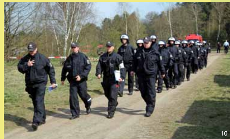
Die Bundespolizeiabteilung Ratzeburg übt den Platz mit wechselnder Intensität. Die Übungsszenarien sind dabei sehr vielfältig. Regelmäßig sind das flächige Befahren des Offenlandes sowie der Einsatz von Wasserwerfern und gegebenenfalls auch Pyrotechnik Bestandteil der geübten Einsätze.