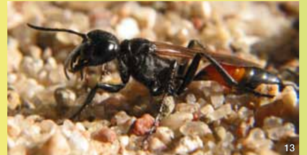
Das Grabwespenweibchen gräbt Röhren in den Sand, in denen sie ihre Larven mit gelähmten Beutetieren füttert.