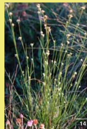
Das Weiße Schnabelried ist eine Art der nassen Moore.