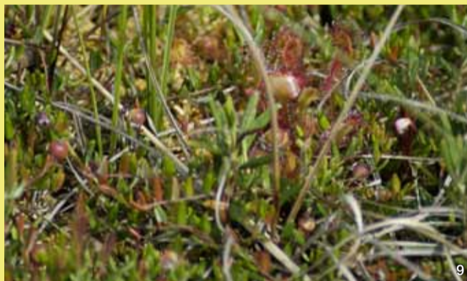
Der Rundblättrige Sonnentau zwischen Rosmarinheide und Moosbeere. Der Sonnentau ernährt sich von Insekten, die er mit dem klebrigen, „taugleichen“ Sekret seiner Drüsenhaare fängt und verdaut.

Diese benötigt für ihre „Verjüngung“ weitgehend von Rohhumusschichten befreite Sandböden. Nur hier kann ihre Saat keimen und zu neuen Heidepflanzen heranwachsen.