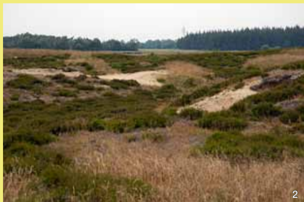
Flache, von Heide bedeckte Hügel und vermoorte Senken bestimmen das Landschaftsbild im Naturschutzgebiet.

NATURA 2000 – Lebensräume erhalten und entwickeln