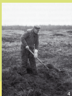
Plaggen der Heide per Hand war eine extrem mühselige Arbeit, die echte „Plackerei“.