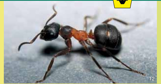
Die Uralmeise ist sehr selten und stark gefährdet.