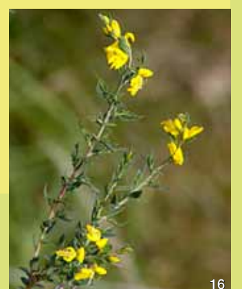
Der Englische Ginster tritt in den trockenen Heiden auf.

Aufgrund der einzigartigen Temperatur- und Trockenheitsbedingungen haben die Heiden und offenen Sandflächen in Schleswig-Holstein eine herausragende Bedeutung für wärmeliebenden Insekten, zu denen unter anderem seltene Schmetterlinge, Sandlaufkäfer, Grabwespen, Sandbienen oder auch Spinnen gehören. Als bedeutend ist das Vorkommen der sehr seltenen Uralmeise zu bewerten, die hier einen der wenigen Standorte in Schleswig-Holstein hat. Auch inzwischen selten gewordene, bekanntere Arten wie Rebhuhn, Zauneidechse oder Kreuzotter finden hier eines der wenigen noch vorhandenen Rückzugsgebiete.