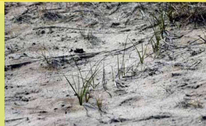
Die Sandsegge, die „Nähmaschine Gottes“, legt mit ihren langen Ausläufern den Dünensand fest.

und die schwer zersetzbare Heide-Streu förderten die Versauerung und Verarmung der Böden und damit die Auswaschung von Mineralstoffen aus dem Oberboden durch den Regen.