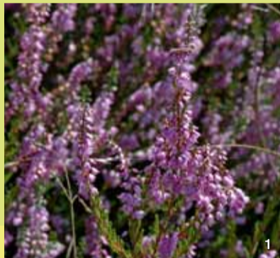
Die Besenheide ist auf dauerhafte Pflege angewiesen, da die Bestände ansonsten vergrasen oder verbuschen.

Das nordöstlich von Lütjenholm, am Rande der Soholmer Au gelegene Naturschutzgebiet „Lütjenholmer Heidedünen“ wurde bereits 1938 in einer Flächengröße von 16,6 ha unter Schutz gestellt. Ziel der Ausweisung war der Erhalt eines von Heiden bedeckten Dünenlandschaftsrestes in einem der größten Flugsand- und Binnendünengebiete der Schleswiger Vorgeest. Neben einigen wenigen anderen Schutzgebieten im weiteren Umkreis handelt es sich um eines der letzten, im Vergleich zur ehemaligen Ausdehnung winzigen Überbleibsel jener Heidelandschaft, die vor 1900 noch weite Landesteile bedeckt hatte. Nach dem Zweiten Weltkrieg konnte das Schutzgebiet nur knapp vor der Aufforstung mit Nadelgehölzen bewahrt werden. Heute ist das NSG eines der Schwerpunktgebiete des Heideschutzes in Schleswig-Holstein. Neben kleinen Heidemooren mit hochmoortypischen Pflanzenarten sind zwischen völlig vergrasteten Bereichen noch großflächig verschiedene Altersstadien besonders schutzwürdiger Trocken- und Feuchtheiden erhalten.