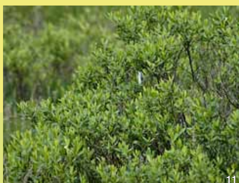
Der Gagelstrauch wurde vor Einführung des Hopfens als Konservierungsmittel für Bier verwendet.