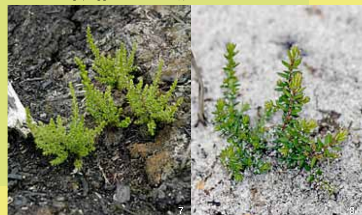
Keimende Besenheide auf der abgebrannten Heidefläche (re) und auf der abgeplaggtten Sandfläche (li)