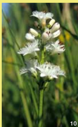
Der Fieberklee findet sich im Torfmoos-Schwingrasen.