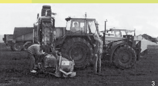
Plaggen mit einer modernen Plagg-Maschine.

Heute kennen wir Dünen eigentlich nur noch von den Küstenregionen an Nord- und Ostsee. Aber es gibt auch im Binnenland Dünen, deren Ursprung auf die Zeit zum Ende der letzten Eiszeit („Weichsel-Vereisung“) zurückgeht. Damals, vor etwa 13.000 Jahren, als die bis zur Linie Flensburg-Schleswig vorgerückten Gletscher weitgehend wieder abgetaut waren, dehnte sich hier eine nur sehr lückig bewachsene Tundra aus. Mit dem Schmelzwasser wurden große Sandmengen nach Westen verfrachtet („Sander“). Die breiten Ströme schnitten sich teilweise tiefer in die Sandflächen ein. Der beständige Wind griff an den Kanten an, wehte den Sand zu Dünen oder Flugsandflächen auf und formte so diese bewegte Dünenlandschaft.