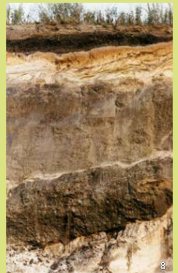
► Teil der Lieth-Serie mit Braunkohleflözen

In der Nordböschung der Liether Kalkgrube ist eine Abfolge aus Sandschichten und Braunkohleflözen angeschnitten, die in die Salzstockoberfläche eingesenkt ist. Es sind Ablagerungen aus dem frühen Eiszeitalter (Lieth-Serie), aus einer Zeit, bevor vor ca. 400.000 Jahren erstmals aus dem Norden kommendes Inlandeis Südholstein überdeckte. Pflanzenreste in den Braunkohleflözen dokumentieren von unten nach oben eine sukzessive Abkühlung des Klimas im Zeitraum zwischen ca. 2,1 bis 0,6 Millionen Jahren vor heute.