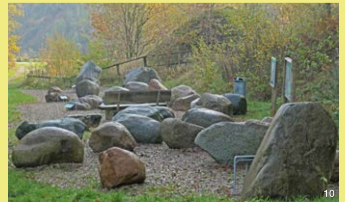
Findlingsgarten in der Liether Kalkgrube

Am Eingangsbereich der Liether Kalkgrube sind 32 Findlinge aufgestellt, die mit eiszeitlichem Inlandeis aus dem Norden nach Südholstein gekommen sind. Die meisten Steine stammen aus Schweden, besonders aus Ostsmåland, einzelne aus Südwestfinland. An einer Auswahl von Findlingen gibt es Tafeln mit Angaben zur jeweiligen Gesteinsart, zum Alter und zur Herkunft. Die Findlinge sind Zeugnisse des Eiszeitalters. Ebenso sind sie mit Gesteinsaltern von bis zu knapp 1,9 Milliarden Jahren uralte Dokumente der geologischen Geschichte Nordeuropas.