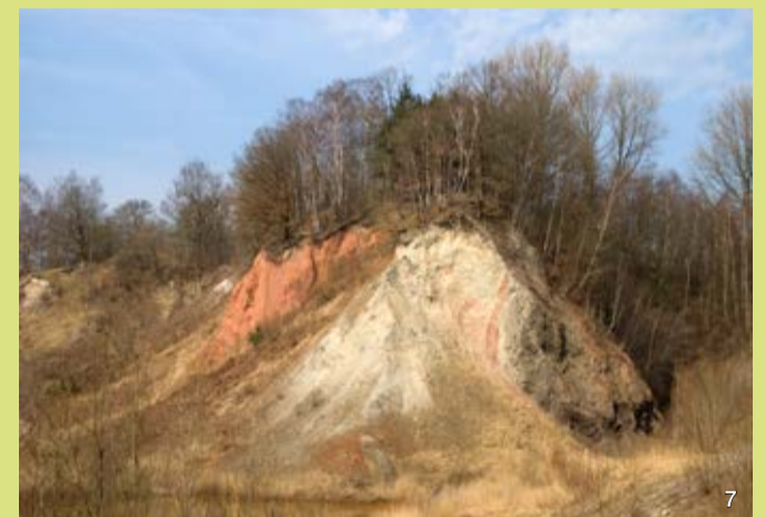
Vermengung von Zechstein- und Rotliegend-Schichten als Abbild der Aufstiegsdynamik im Salzstock

Weitere permische Gesteine der Liether Kalkgrube sind Zechsteinkalk, Sandstein und Tonstein des Rotliegend sowie Zechstein-Stinkschiefer, der im frischen Bruch nach Erdöl riecht. Die Gesteine des Zechstein samt angrenzendem Rotliegend wurden beim Salzstockaufstieg als zusammenhängende Scholle aus ihrem ursprünglichen Verband in der Tiefe herausgetrennt und nach oben geschleppt.