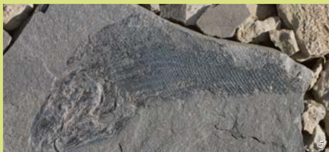
Kupferschiefer der Liether Kalkgrube mit fossilem, heringsgroßem Fisch „Palaeoniscus freieslebeni“ (Alter: 257 Millionen Jahre).

Dieses Faltblatt wird im Rahmen des Besucherinformationssystems (BIS) für Naturschutzgebiete und NATURA 2000-Gebiete in Schleswig-Holstein vom Landesamt für Landwirtschaft, Umwelt und ländliche Räume des Landes Schleswig-Holstein (LLUR) herausgegeben. Dieses und weitere Faltblätter des BIS können kostenlos beim LLUR bestellt werden: