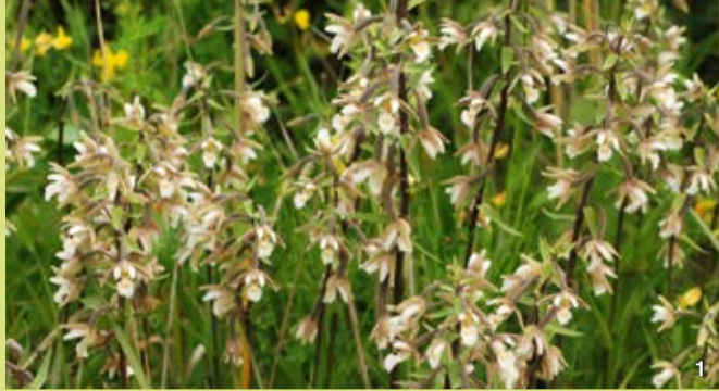
Sumpfstendelwurz (1), Knabenkraut (2) und Sumpferzblatt (3)

Zu den gefährdeten Tierarten gehören Amphibien wie Kreuz- und Knoblauchkröte, Reptilien wie Zauneidechse und Ringelnatter, wärmeliebende Insekten sowie höhlenbrütende Vögel. Gelegentlich sind Graureiher, Eisvogel und Neuntöter zu beobachten.