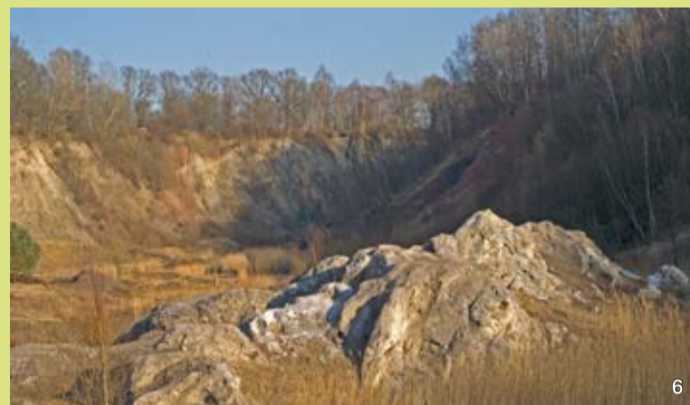
Felskuppe aus hellgrauem Gipsgestein des Zechstein, im Hintergrund die Ostwand. Der Gipsfelsen ist zerbrechlich. Er darf nicht betreten werden

Perm in Schleswig-Holstein, die sowohl Wüstenablagerungen des Rotliegend als auch Meeresablagerungen des Zechstein umfasst. Mit Altern von bis zu ca. 260 Millionen Jahren gehören hierzu die ältesten, in festem Gesteinsverband an der Oberfläche vorkommenden schleswig-holsteinischen Gesteine. Sie sind in einem Salzstock von ca. 5 km Durchmesser aus mehreren Kilometern-Tiefe aufgestiegen.