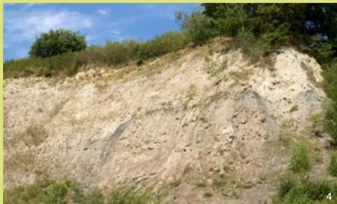
Schichtfolge in der Ostwand: unten Zechsteinkalk, in mittlerer Höhe Kupferschiefer (schwarz), darüber Sand und Sandstein des Rotliegend. Die Schichtfolge ist überkippt (Jüngeres unter Älterem).

In der Mitte des 19. Jahrhunderts begann in der Nähe des Flurabschnitts, der heute von der Liether Kalkgrube eingenommen wird, die Gewinnung von rotem Ton zur Ziegelherstellung. Die heute 35 m tiefe Liether Kalkgrube entstand durch die 1925 begonnene Gewinnung von Düngerkalk. Seit 1991 steht die Liether Kalkgrube unter Naturschutz. Sie ist das einzige Oberflächenvorkommen einer Schichtfolge aus dem Erdzeitalter