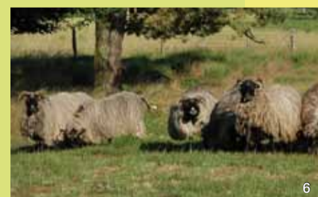
Die Heiden und Trockenrasen werden in Hüttehaltung beweidet.

Neben der Stiftung Naturschutz tragen die Gemeinde Bark sowie der Kreis Segeberg maßgeblich zur Umsetzung der Naturschutzziele im Gebiet bei.