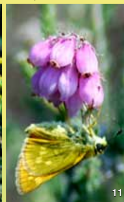
Glockenheide mit Dickkopffalter