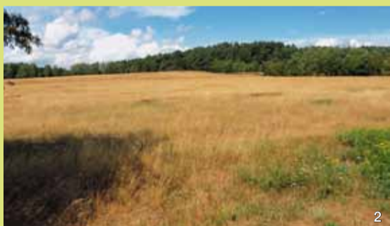
Die Dünen sind kaum noch erkennbar. Der größte Teil ist mit Kiefern bestanden. Nur im Westen setzt sich ein alter Dünenzug im angrenzenden Extensivgrünland fort.

Die Barker Heide liegt in der Holsteinischen Vorgeest. Während der letzten Eiszeit haben Schmelzwässer der abtauenden Gletscher hier mächtige Sander aufgeschüttet. Später trug dann der Wind den Sand zu Flugsanddecken und Binnendünen zusammen.