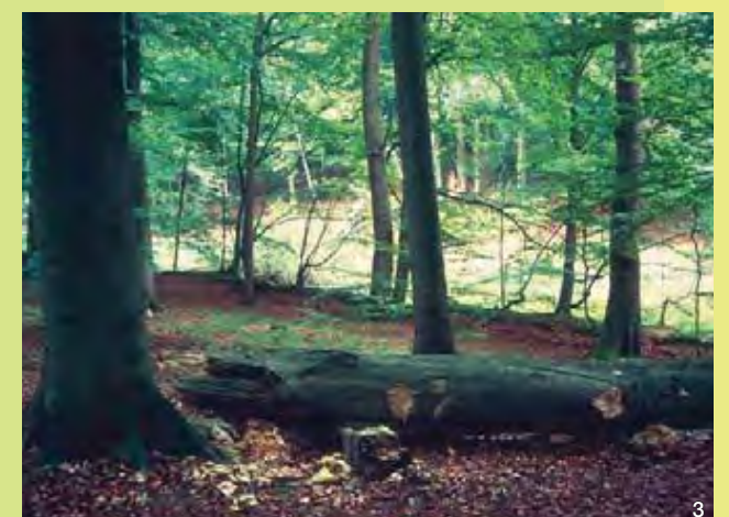
Totholz ist wichtiger Bestandteil des Naturwaldes

Im Naturwald sollen keinerlei menschliche Eingriffe die Prozesse des Ökosystems stören. Die Bäume können das natürliche Alter erreichen bis sie absterben oder durch andere Ereignisse wie Sturm oder Eis und Schnee, zusammenbrechen. Das abgestorbene Holz wird auf natürliche Weise wieder zersetzt, wodurch die im Holz gespeicherten Nährstoffe dem Kreislaufsystem Wald nach und nach wieder zugeführt werden. Viele Vögel, Insekten und Pilze finden dadurch zusätzlichen Lebensraum.